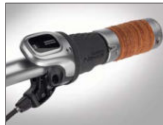
Schön: Ledergriffe und -sattel bilden mit dem Korb eine ästhetische Einheit.

Egal, ob beladen oder nicht, nach kurzer Eingewöhnungsphase hat man schon bald die Souveränität über das PackBernds wiedergefunden. Die Rahmengeometrie, die kleinen Laufäder und die sehr direkte Lenkung geben dem Rad eine erstaunliche Wendigkeit. Mit Last zeigt es sich dennoch sehr stabil und man hat nie das Gefühl, die Kontrolle zu verlieren.