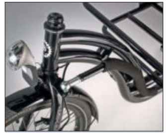
Lenkstangen-Anlenkung am Vorderrad und Busch & Müller Frontlicht

Das Gefährt aus Stahl lässt sich aus einer übersichtlichen und angenehm aufrechten Sitzposition mit Blick aufs Ladegut und die gut abschätzbare, schmale Durchgangsbreite nach kurzer Eingewöhnungszeit auch mit Beladung erstaunlich leicht & souverän dirigieren. Nur bei zu engem Einschlag (Wendekreis ca. 5,50 cm) schiebt das 47,2-kg-Gefährt (Radstand 2,5 m) geradeaus, das muss man bei Beladung beachten. Prima: das von einem Gestänge angelenkte Vorderrad dreht sich auch unter Last leicht. Mit etwas Übung lässt sich das Rad schwingvoll auf